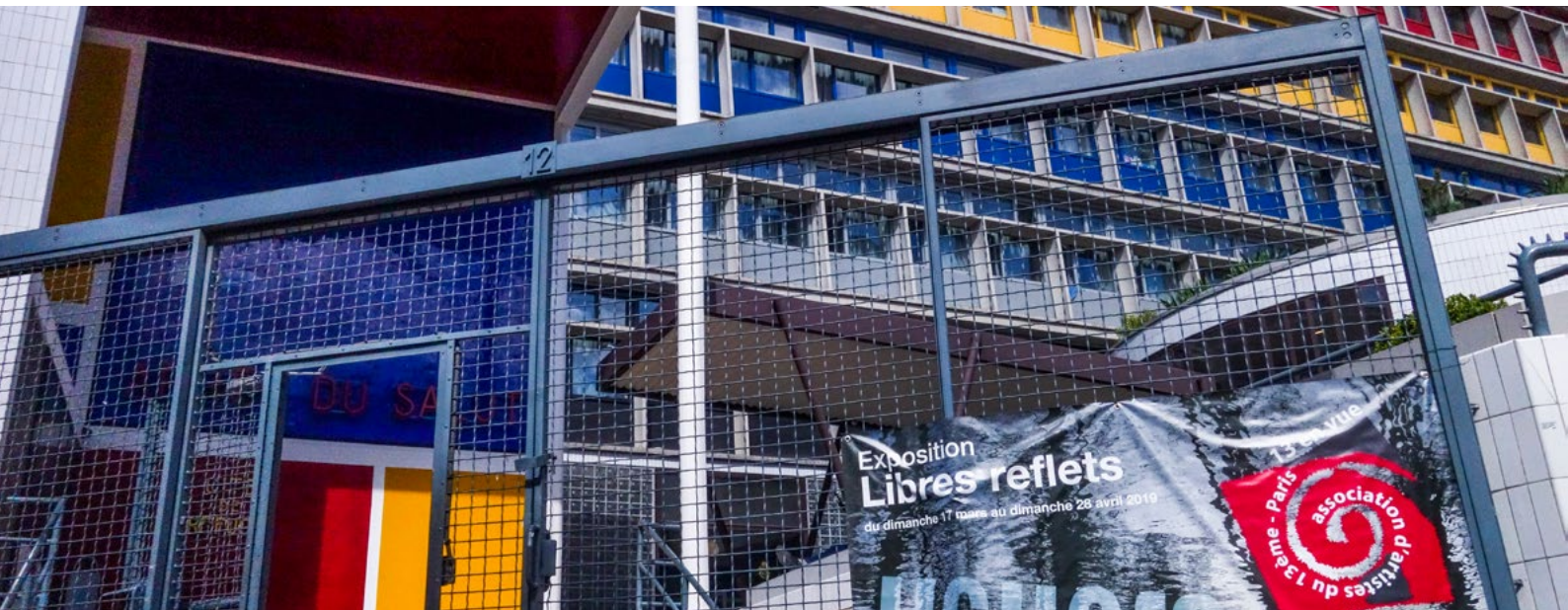
L'entrée de la Cité du Refuge (12, rue Cantagrel, Paris 13ème)

Les artistes de l'Association se sont mobilisés sur cet événement et ont travaillé le thème proposé, car ce lieu magnifique et inhabituel est attirant. Il l'est non seulement par son architecture sobre et rectiligne, mais aussi par ce qui s'y passe.