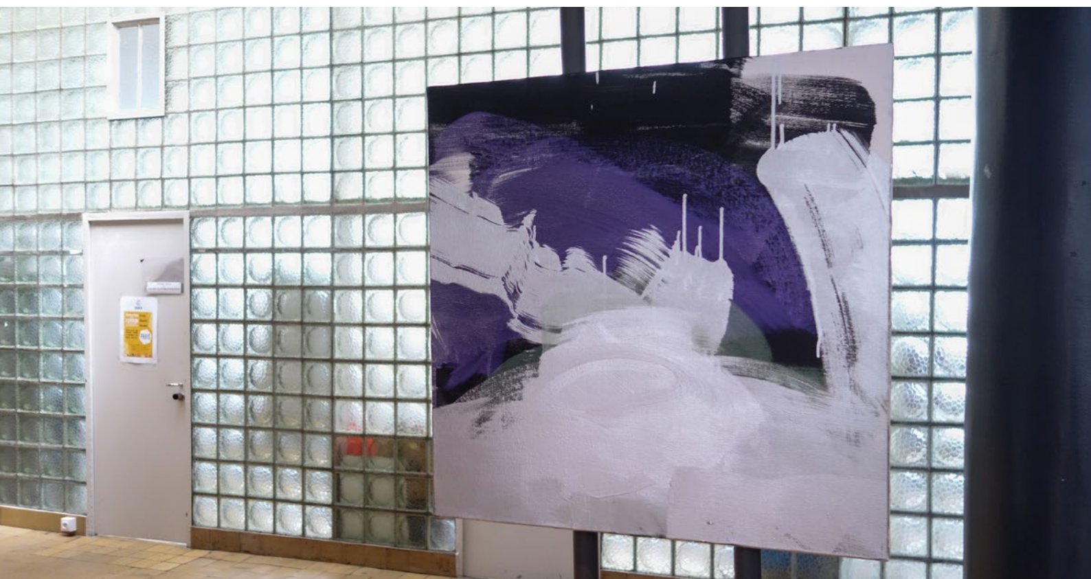
Peinture de Franck Bertran

Elle est aussi l'occasion pour le public de découvrir le 1er édifice de cette importance conçu par Le Corbusier à Paris, à découvrir notamment pendant les Journées Européennes du Patrimoine les 21 et 22 septembre 2019.